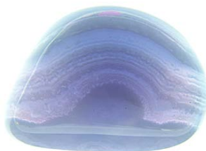
Abb.: Chalcedon, repräsentiert als Beratungsstein das Thema Kommunikation.

Demonstrationsobjekt bestimmter Personen, Aufgaben oder Prozesse ausgewählt werden, mehr als nur ein „Platzhalter“. Sie offenbaren durch ihren vielschichtigen Bezug zum Unterbewusstsein des Menschen das innere Erleben, d.h. Einstellungen, Betrachtungen, Gefühle, Stimmungen und unbewusste Haltungen gegenüber einer bestimmten Situation oder Aufgabenstellung. Dadurch signalisieren sie dem Coach, welche Themen noch zu betrachten und welche Lösungen anzustreben sind, damit vernünftige Entscheidungen und Planungen auch emotional angenommen und umgesetzt werden.