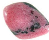
Rhodonit: Verständnis und Heilung

davon, ob die Beteiligten darum wissen oder nicht. Selbst das Verhalten von Kindergartenkindern zeigte in lithotherapeutischen Studien signifikante Veränderungen, je nachdem, welche Steine sich im Raum befanden.