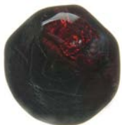
Granat: Der Krisenstein

Edelsteine geben Ihnen Informationen über Ihren Coachee / den Prozess, die Sie sonst vielleicht nie bekommen würden