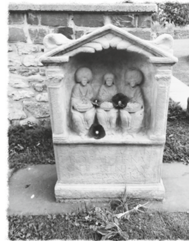
Weihestein mit Gaben für Matrona auf der Görresburg oberhalb von Nettersheim, Nordrhein-Westfalen

Matrona wird auf den Weihesteinen in ihrer Erscheinung als Greisin-Mädchen-Mutter abgebildet. Dies verraten uns die Hauben, die, der germanischen Tracht der Ubierinnen entsprechend, nur von verheirateten Frauen getragen wurden. Dies bedeutet,