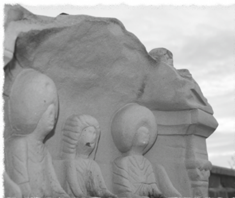
Die drei Gesichter Matronas (auf einem Weihstein auf der Görresburg)

schenkt. Die Birne bildet in ihrer Form die Gebärmutter ab, in der das neue Leben entsteht. Beide Früchte sind somit weibliche Ursymbole, die Leben, Sterben und Wiedergeburt versinnbildlichen. In den Schoß der Göttin kehrt alles zurück, was stirbt, und aus ihrem Schoß werden wir wiedergeboren. Darum wird Matrona auf dem deutschen Jahresrad der Göttin vor allem im Nordwesten in ihrem Aspekt als Greisin, als Todesbotin und Verwandlerin, verehrt.